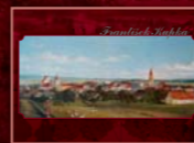
Panoráma Dobrušky, olej na plátně, 1889, 128x228 cm (s rámem) Dobruška Panorama, oil on canvas, 1889, sized 128 x 228 cm (framed) Panorama Dobruški, olej na płótnie, 1889, 128x228 cm (z ramą)